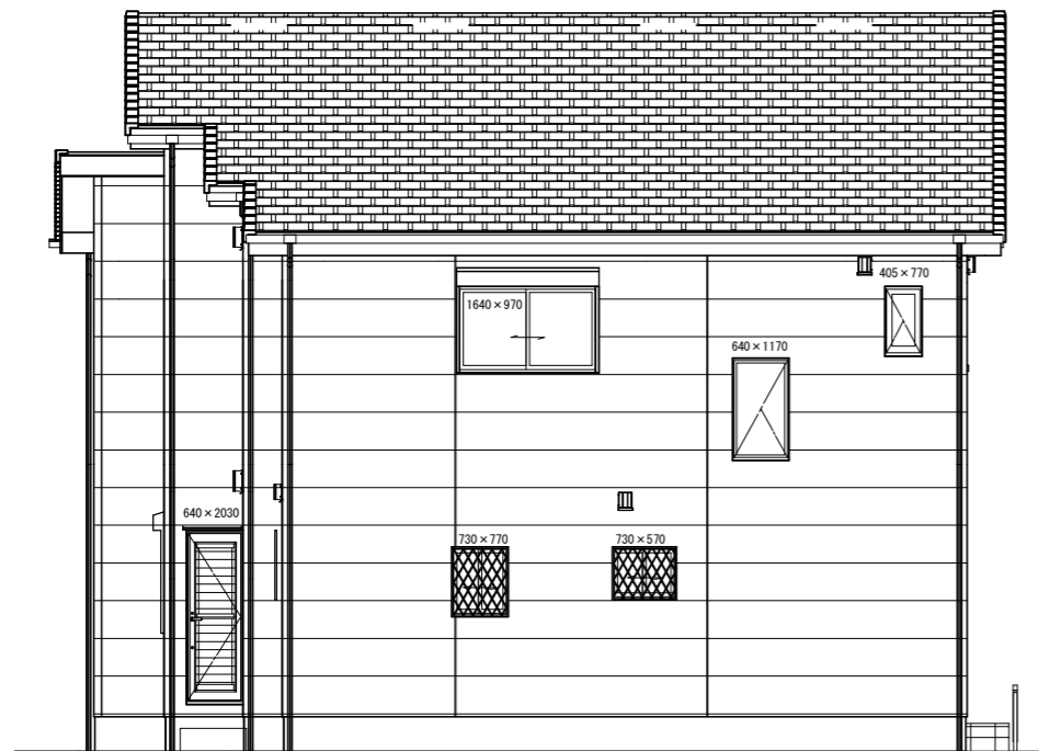
北側 立面図 S:1/100