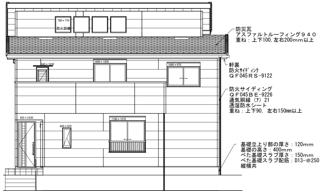
南側 立面図 S:1/100