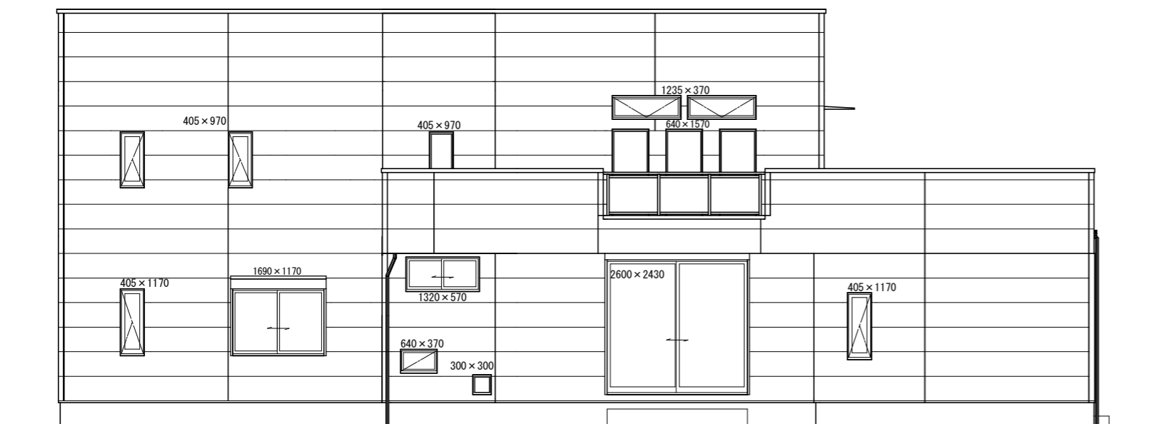
北側 立面図 S:1/100